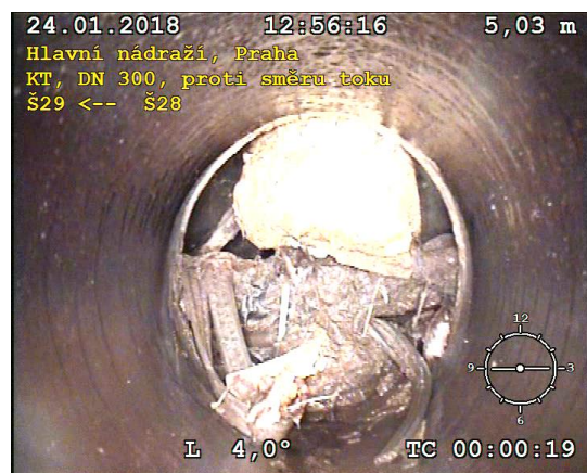
FOTO Š29-Š28.2 (úsek 19) Překážky - potrubí v Š28 zanesené napadanými předměty