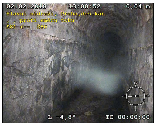
FOTO Š81-Š80 (úsek 62) Velkoprofilová stoka - zanesená v dolní části