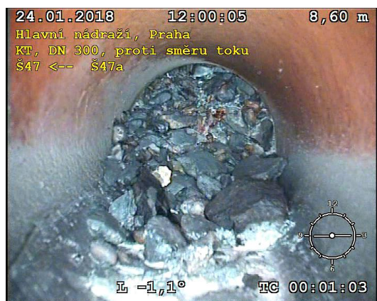
FOTO Š47-Š47a (úsek 16) Překážka v celém Ø - otrubí zavaleno kamenitou sutí