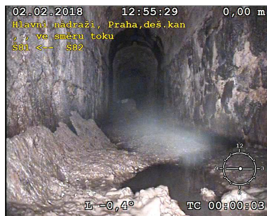
FOTO Š81-Š82 (úsek 61) Velkoprofilová stoka - zanesená v dolní části

TvS-centrum Praha, s.r.o. vodovody-kanalizace Únětice č.p. 108, 252 62 Praha-západ tel./fax: 220 971 040 Dič: CZ26728231